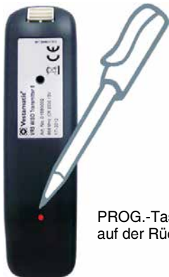
PROG.-Taste auf der Rückseite.

Drücken und halten Sie die „STOPP-Taste“ (mittlere Taste) für 3 Sekunden, bis die LEDs blinken. STOPP-Taste loslassen und mithilfe der AUF- oder AB-Taste den Kanal wählen und mit der „STOPP-Taste“ bestätigen.